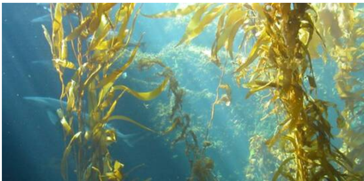
Rong biển có chứa Fucoïdan tại Nhật Bản